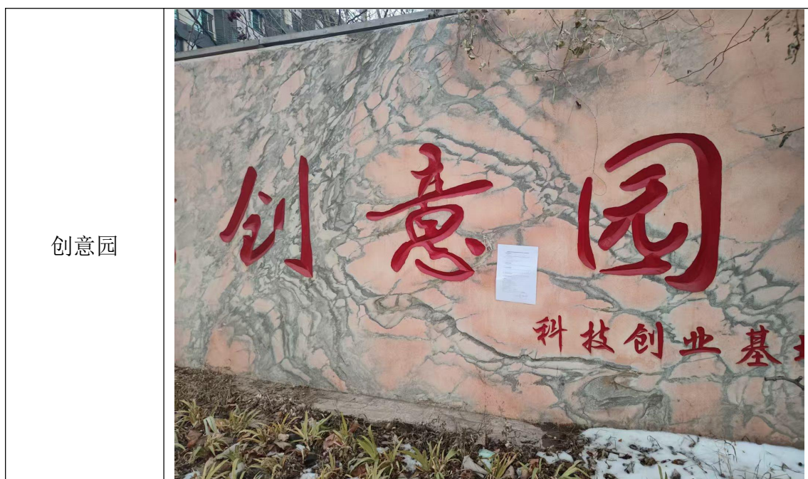
图 3.2-4 现场张贴照片