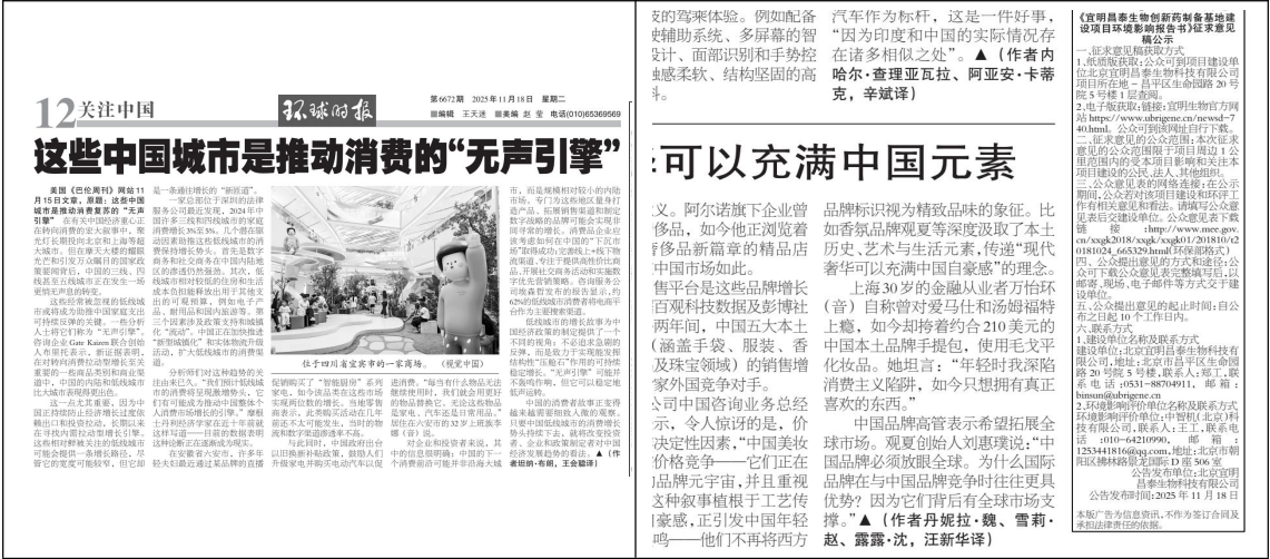
图 3.2-3 报纸公示（2025 年 11 月 18 日）

建设单位于 2025 年 11 月 05 日在厂址周边进行了公示张贴。现场照片见图