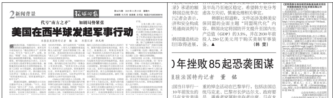
图 3.2-2 报纸公示 (2025 年 11 月 15 日)

根据办法要求, 建设单位在环球时报于 2025 年 11 月 15 日和 2025 年 11 月 18 日两次进行了公开公示。报纸照片见图 3.2-2~3.2-3。原件存档备查。